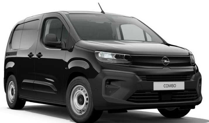
BLACK PERLA NERA