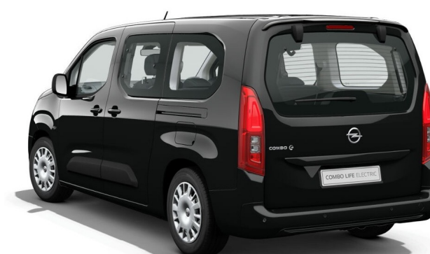
Black Perla Nera