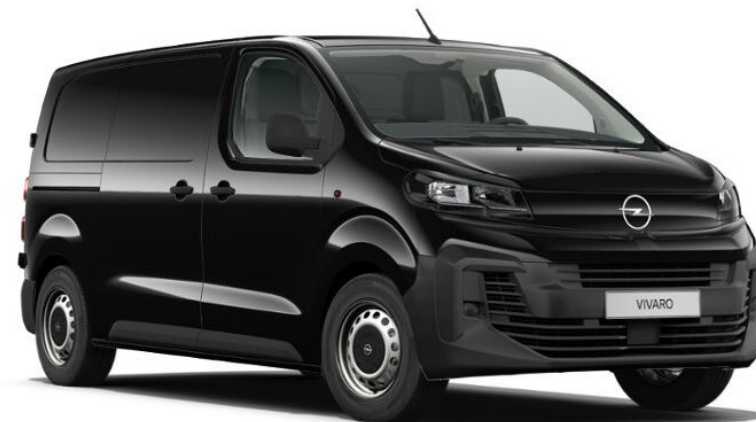
BLACK PERLA NERA