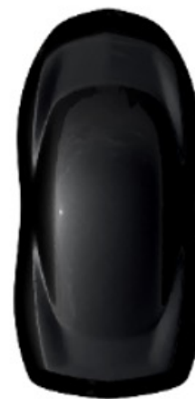
Black Perla nera