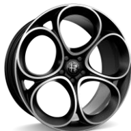
Speciale 8,5 x 20