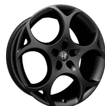
Turismo 8,5 x 21