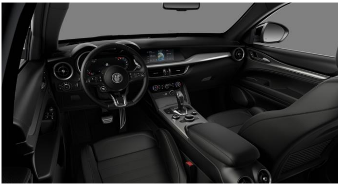
423 | Juodos odinės sėdynės ir apmušalai