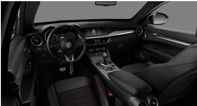
646 | Juodos odinės „Tributo Italiano“ sėdynės ir apmušalai su raudonais akcentais