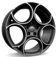
Classico 8,0 x 19